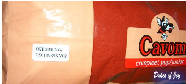
Fig.3: Datumsticker op een zak puppyvoer

Alternatief is natuurlijk dat u uw puppyvoer bij uw fokker koopt, als het goed is heeft hij altijd vers voer op voorraad of kan dat direct bij de fabrikant kopen omdat hij grotere hoeveelheden afneemt.