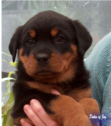
Fig. 1: Rottweiler pup

De eerste dag dat u met uw pup thuiskomt moet hij of zij een beetje acclimatiseren. Realiseert u zich dat uw pup weg is uit zijn vertrouwde omgeving, zijn zintuigen worden geprikkeld door allemaal andere luchten en geluiden en zien andere vormen en kleuren. Hij zal moeten wennen aan zijn eigen, nieuwe plek bij een andere roedel (!) dan waar hij geboren is. In plaats van zijn moeder heeft hij nu een bench als beschermende plaats waar hij gaat leren om te slapen. Tja....een hele overgang dus!