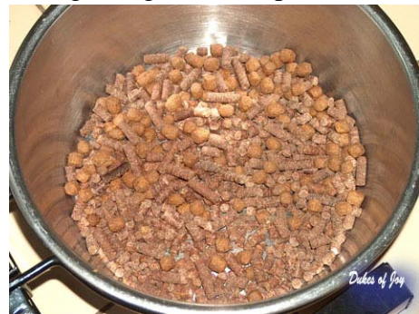
Fig.2: Mix van 2 soorten puppyvoer

Koop altijd een 'compleet' puppyvoer, zodat u er zeker van bent dat uw pup alles in voldoende mate én in de juiste verhouding binnen krijgt. Dit is erg belangrijk. Honden behoren tot de snelst groeiende zoogdieren. Om die groei in de eerste maanden van zijn leven gebalanceerd te laten verlopen, is ook uitgebalanceerde voeding nodig. Botten, spieren en pezen krijgen het vaak zwaar te verduren, terwijl ze daar nog niet aan toe zijn. Veel blessures lopen pups op wanneer ze (te) veel spelen met grote honden of (te) lange afstanden moeten lopen. Pups zijn nog zeer kwetsbaar, en kunnen fysiek nog niet veel aan. Als eigenaar van een pup moeten we die belasting in de gaten houden. Om nu te zorgen dat ze op termijn wel tegen fysieke belasting bestand zijn, moeten we ze kwalitatief en goed te eten geven wanneer de pups jong zijn en nog veel moeten groeien.